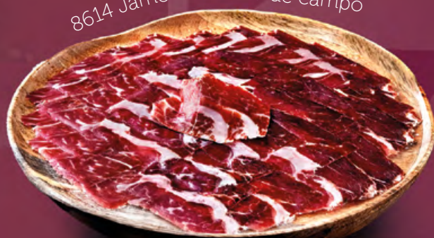
8614 Jamón de cebo de campo

Autenticidad, raíces y origen al estilo artesano