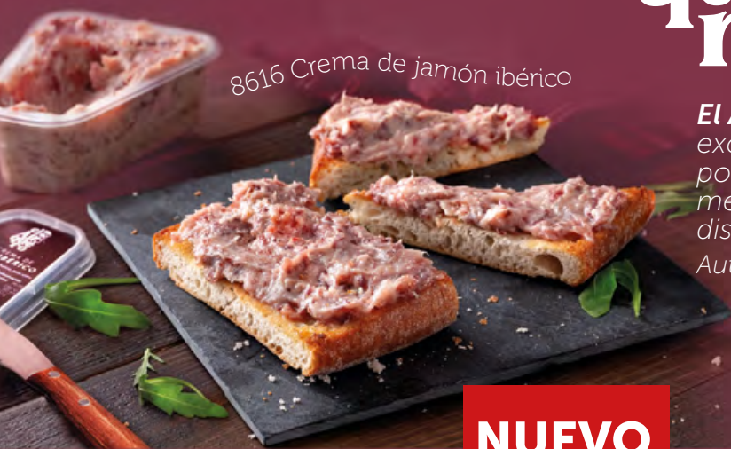
8616 Crema de jamón ibérico