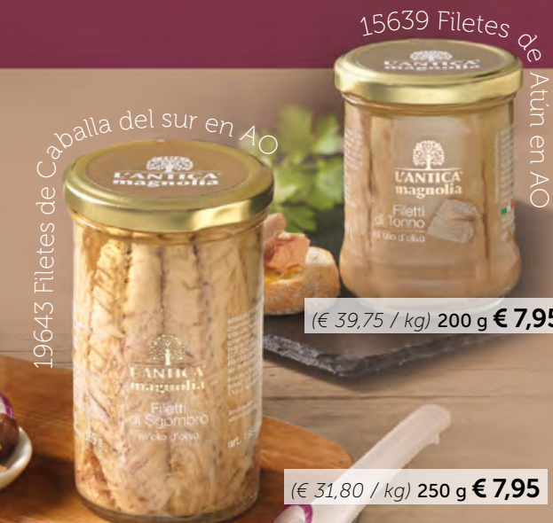
19643 Filetes de Caballa del sur en AO