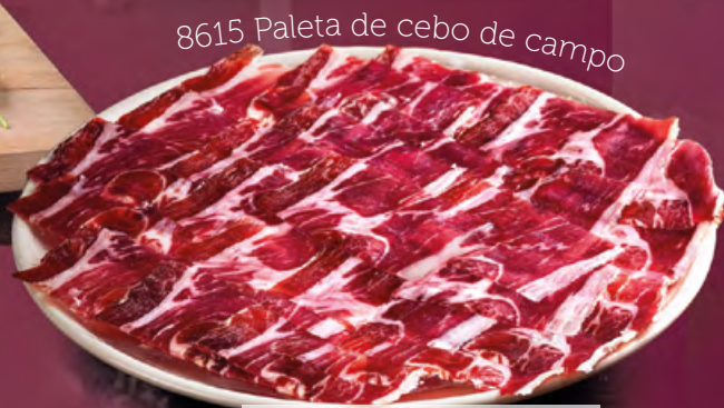
8615 Paleta de cebo de campo