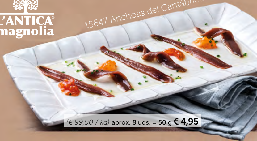
15647 Anchoas del Cantábrico en AO

(€ 99,00 / kg) aprox. 8 uds. = 50 g € 4,95