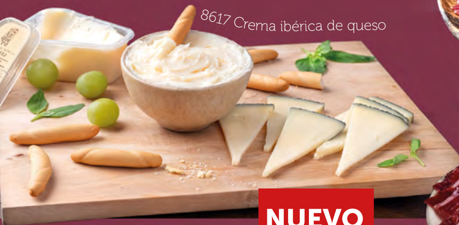
8617 Crema ibérica de queso